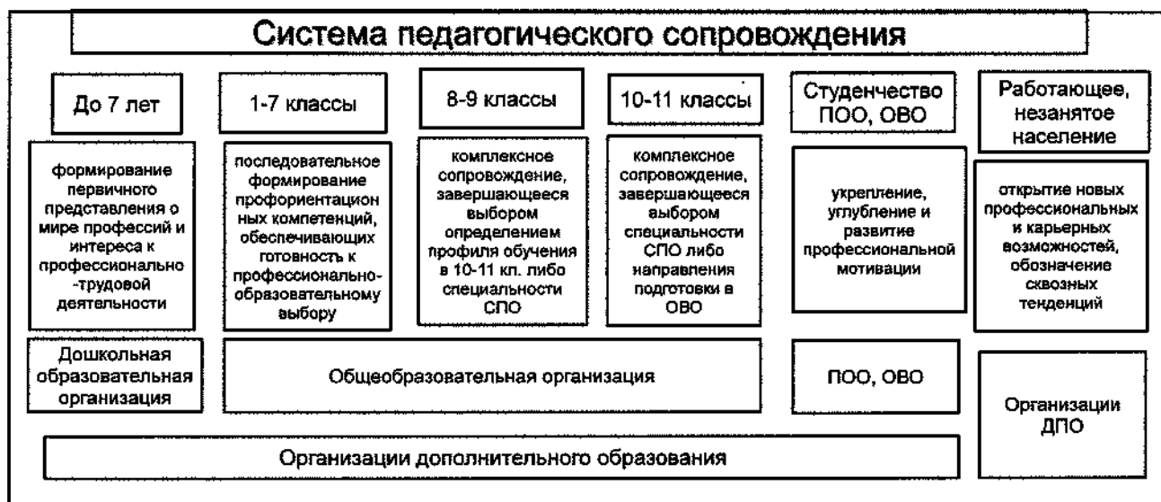
Рисунок 1. Модель педагогического сопровождения профессионального самоопределения обучающихся

В качестве конкретизированных объектов модели педагогического сопровождения профессионального самоопределения обучающихся выделены основные возрастные образовательные группы, с которыми возможна работа по психолого-педагогическому сопровождению профессионального самоопределения (рис. 1).