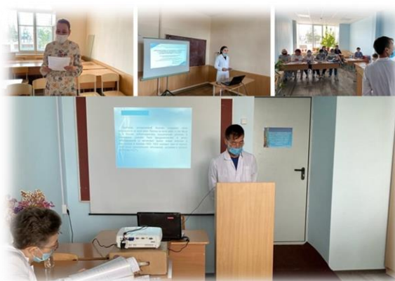
Защита выпускных квалификационных работ

Поздравляем наших выпускников с окончанием обучения и присвоения квалификаций: Фельдшер, Медицинская сестра, Медицинский брат! Желаем вам осуществления задуманных планов и успехов в освоении специальности!