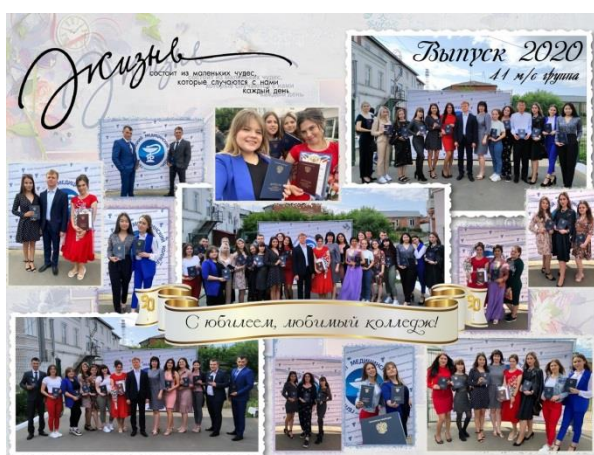
Выпуск 2020, 41 м/с группы