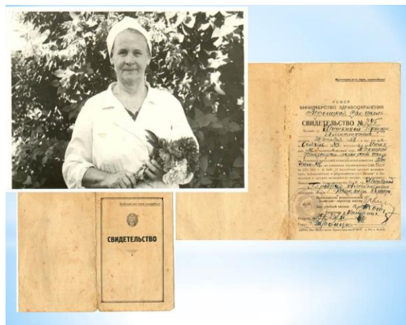
Фотографии размещены в «ВКонтакте», сообщество ГБПОУ ТМК

Была награждена множеством грамот и благодарственных писем за добросовестное выполнение своих обязанностей и высокую трудовую дисциплину.