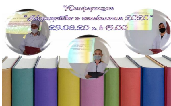
Конференция «Акушерство и гинекология 2020»