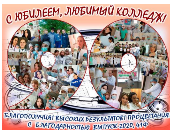
Выпуск 2020, 41 ф группа