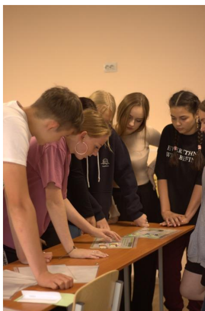
Поздравляем команды победителей и призеров игры