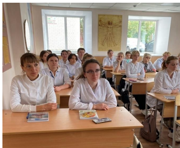
Студенты 41 ф группы провели внеклассное мероприятие на тему: «Всемирный день оказания первой медицинской помощи»