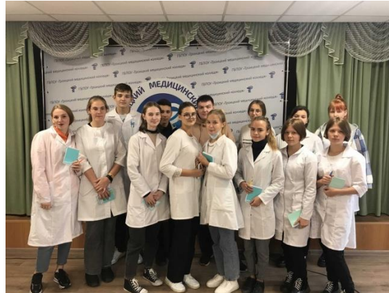
Актив первых курсов на студенческом совете 29 сентября