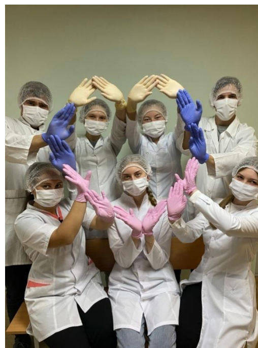
Студенты третьего курса Сестринского дела