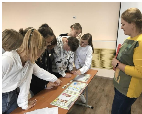
Квизовое мероприятие 1 курса