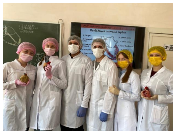
Мастер класс «В ритме сердца»