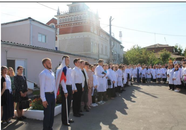
Линейка 1 сентября

Все участники были награждены дипломами и сладкими призами от студенческого Профсоюза. Выражаем большую благодарность классным руководителям учебных групп 1 курса, а также библиотекарю колледжа за подготовку увлекательных заданий квеста.