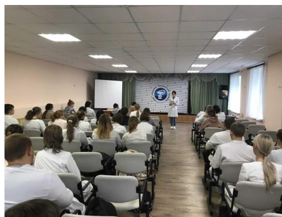
Заседание студенческого совета в актовом зале