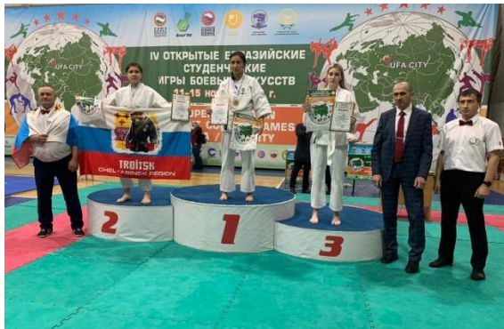
IV Евразийских студенческих игр боевых искусств

Спасибо всем участникам фестиваля за талантливые работы!