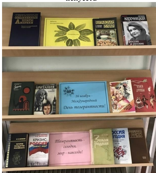
Выставка «Толерантность – путь к миру!»