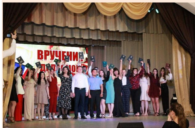
Выпускники 41 м/с группы