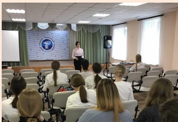
Итоговое заседание Студенческого совета колледжа