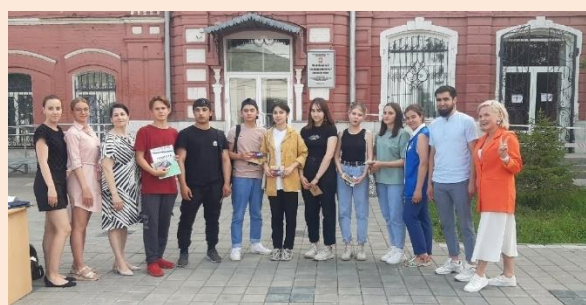
Участники городской блиц-игры "#PROвозможности" ко Дню молодежи в России