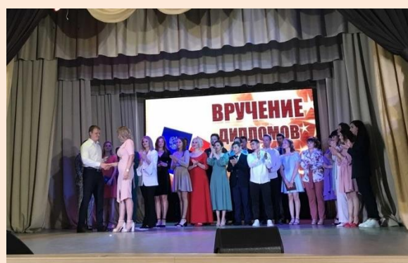
Вручение диплом об образовании выпускникам 41 ф группы