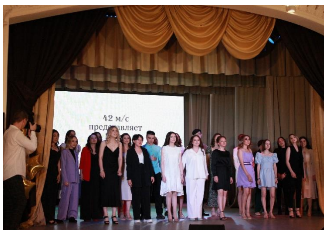
Выпускники 42 м/с группы