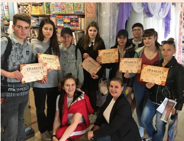
Студенты 1 курса Троицкого медицинского колледжа приняли участие в квесте на приз редакции газеты "Вперед"