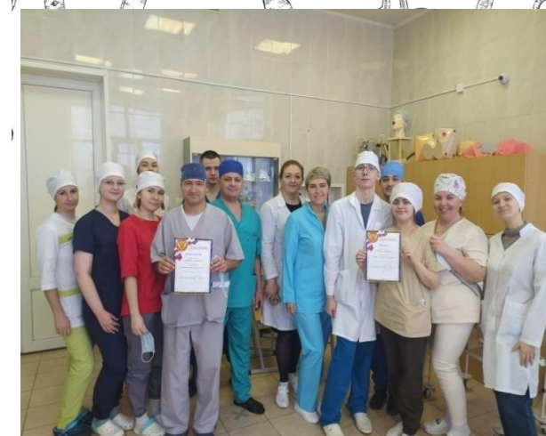
Олимпиада «Знатоки в хирургии»