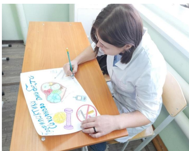
Сахарный диабет – актуальная проблема XXI века

Целью проведения акции было расширение знаний студентов о диабете и его профилактике путём создания информационных плакатов.