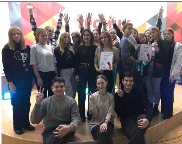
Команда вокалистов колледжа