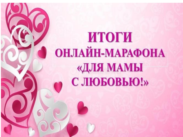
Каждый студент был рад принять участие в марафоне