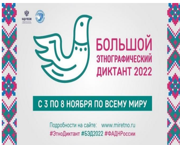
Большой этнографический диктант