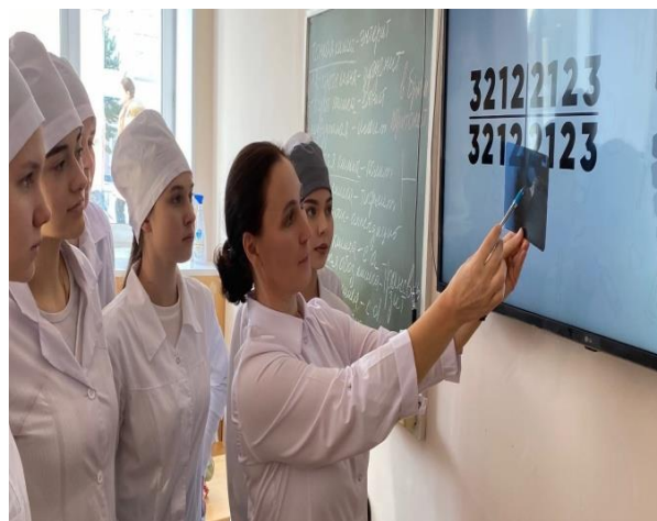
Практическое занятие по дисциплине «Анатомия и физиология человека»

Количество корней может быть различным. Часто можно встретить зуб мудрости с четырьмя корнями, а порой даже и с пятью. Бывают и однокорневые восьмые зубы-это связано с эффектом «сросшихся друг с другом корней», которые визуально выглядят как один массивный зуб.