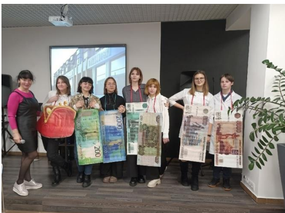
«Время – деньги!»