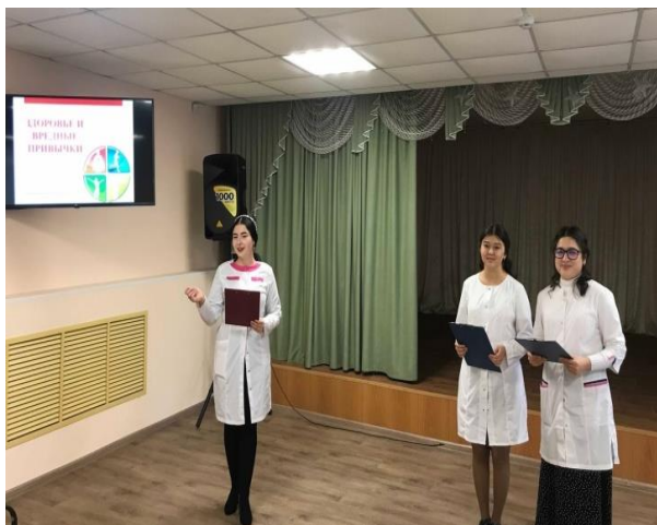
В ходе мероприятия студенты были осведомлены о вреде алкоголя

3 ноября в Троицком медицинском колледже прошло мероприятие по профилактике употребления алкоголя среди несовершеннолетних студентов. С целью формирования у студентов личной негативной позиции по отношению к алкоголю и мотивации на здоровый образ жизни в группах 1 и 2 курсов специальности Сестринское дело были проведены часы общения.