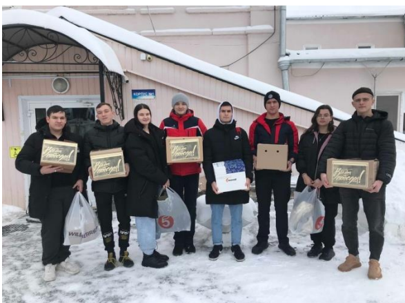
Спасибо всем, кто помог в сборе вещей!