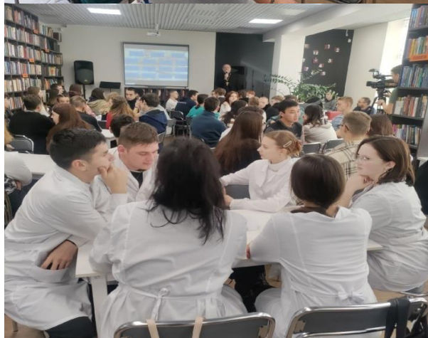
Интеллектуальные игры проходят на ура