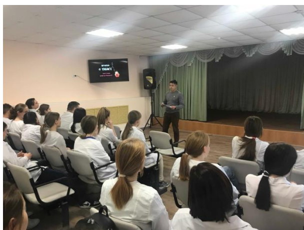
Профилактическую беседу провели классные руководители первых курсов

10 ноября в колледже прошли классные часы в группах 1 курса, приуроченные к Международному дню отказа от курения.