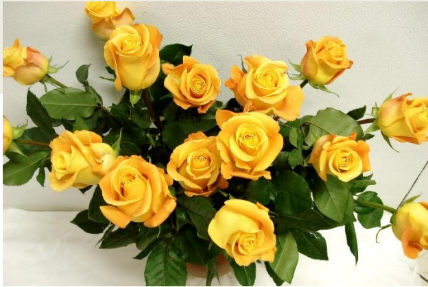
Цветы для педагогов от Студенческого Совета