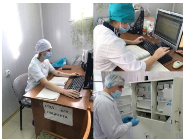
Коллаж медики-волонтеры г.Южноуральск, выпускная группа 34.02.01 Сестринское дело

Затем подключились медсестры четвёртого курса, которые работают с документацией, отвечают на вызовы, вникают в работу системы БАРСа. В настоящее время задействовано около 50 студентов. Вся работа осуществляется под кураторством врачей и руководства медицинских организаций и колледжа.