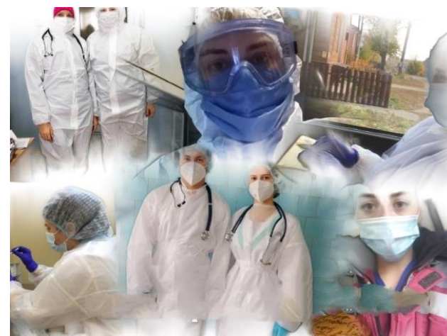
Коллаж медики-волонтеры, выпускная группа 31.02.01 Лечебное дело

В резерве в режиме «боевой» готовности находится ещё сто студентов - это ещё две группы медсестёр четвёртого курса и медсестры и фельдшера третьего курса.