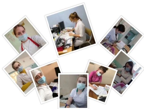
Коллаж медики-волонтеры г.Троицк, выпускная группа 31.02.01 Лечебное дело

Вот уже больше недели студенты Троицкого медицинского колледжа оказывают помощь в работе медицинских организаций города Троицка и Южноуральска.