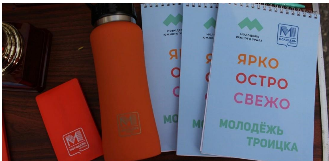
Военно-спортивные сборы «Патриот»