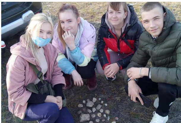
Обучающиеся 11 м/с группы на исторической экскурсии