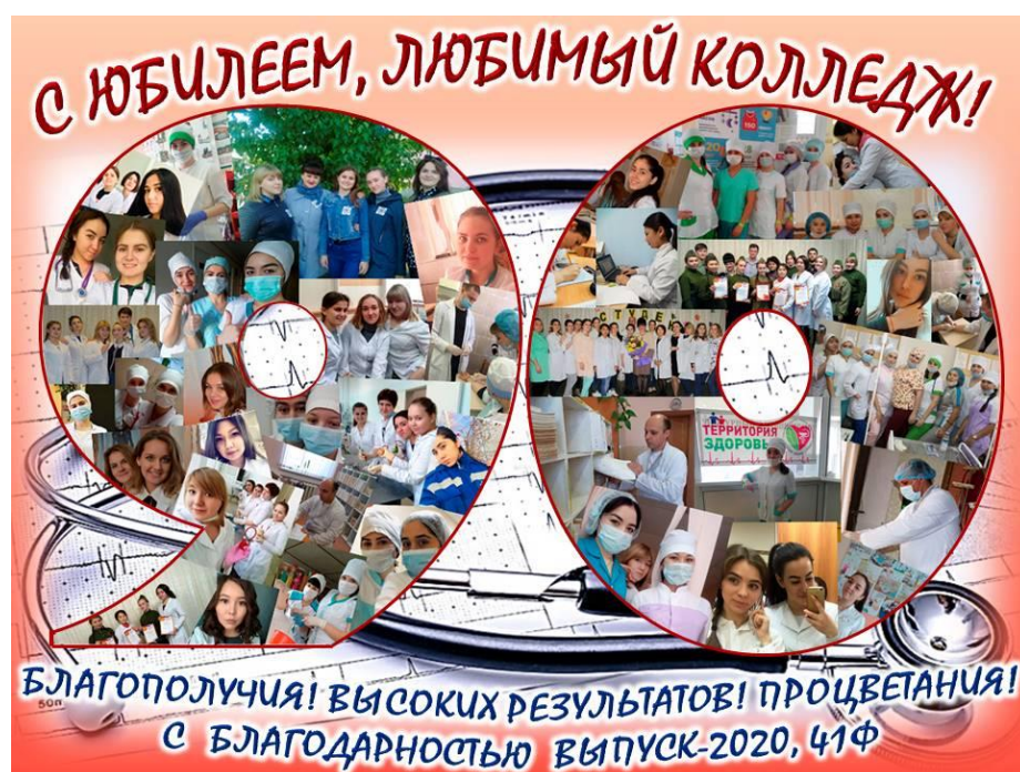
Рис.4 Выпуск 2020 г., группа 41 ф

Именно ветераны колледжа как опытные специалисты, которые проработали значительное время и вышли на заслуженный отдых, занимают особое положение, передача их исторического наследия нынешним и будущим студентам очень важна для воспитания полноценных разносторонних личностей. Ветераны колледжа через создание летописи взаимодействия с педагогами и студентами сохраняют историю образовательного учреждения, передают молодым ценности, учат их секретам и премудростям профессионального и жизненного опыта.