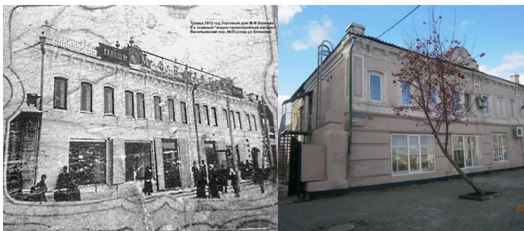
Рис.2 Троицкий медицинский колледж переехал в историческое дореволюционное здание, бывший «Модно-галерейный магазин» купца М.Ф. Валеева, по адресу: г. Троицк, ул. Климова, д.17, где находится и по сегодняшний день

На основании распоряжения Правительства Челябинской области от 24.11.2015 года № 662-рп «О переименовании образовательных учреждений» Государственное бюджетное образовательное учреждение среднего профессионального образования (среднее специальное учебное заведение)