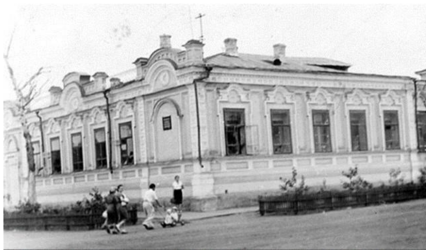
Рис.1 Первое здание, в котором находилась фельдшерско-акушерская школа расположено по адресу: г. Троицк, ул. Володарского, д.9.

Первый выпуск состоялся в 1933 году и составил 76 человек. Выпускники были направлены на работу в города и сельские районы области, где ощущалась острая нехватка квалифицированных кадров. Многие из них на местах возглавили в дальнейшем органы здравоохранения. В августе этого же года Троицким окружным Комитетом РОКК были организованы курсы медицинских сестер запаса имени ХУИ «Съезда партии». Курсы имели огромное значение в области подготовки кадров по укреплению санитарной оборона страны.