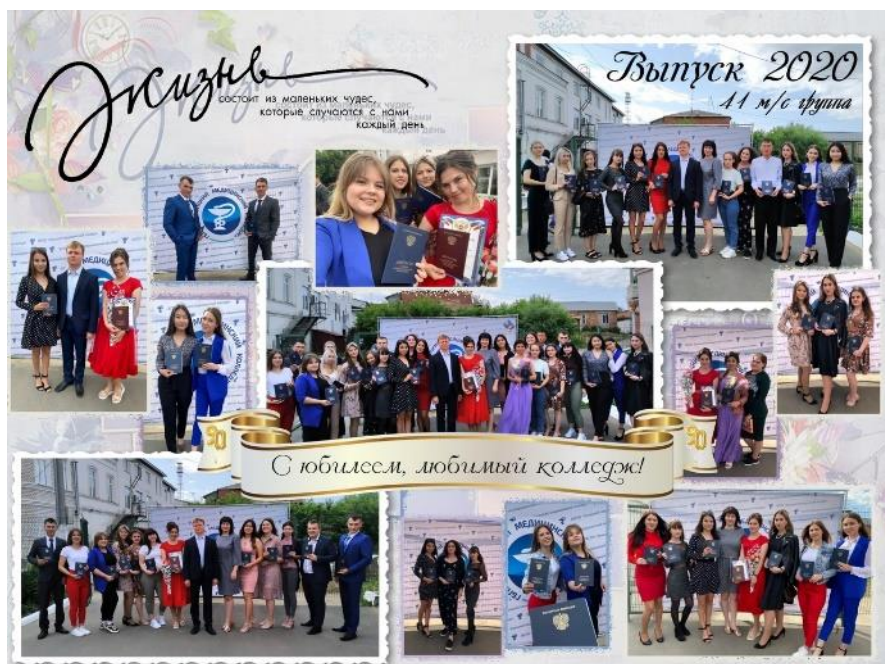
Рис.3 Выпуск 2020 г., группа 41 м/с

Поздравляем преподавателей, сотрудников, ветеранов труда с Юбилеем колледжа! Желаем крепкого здоровья, оптимизма, бодрости духа, долгих лет!