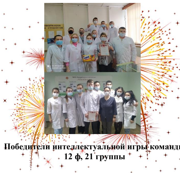
Победители интеллектуальной игры команды 12 ф, 21 группы

Закон есть высшее проявление человеческой мудрости, использующее опыт людей на благо общества