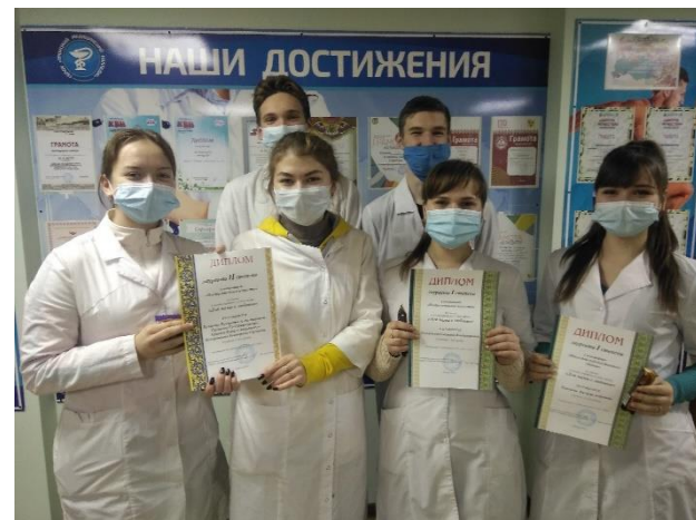
Победители онлайн-марафона «Для мамы с любовью»

Спасибо всем студентам за проявленный интерес к конкурсу и талантливые работы – подарки для мамы с любовью!