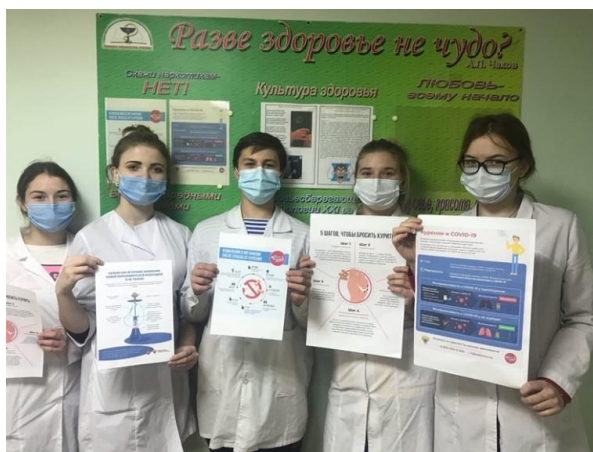
Профилактическая акция «Мы выбираем здоровую жизнь без сигарет!», обучающиеся 22 м/с группы